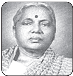
ā000 ĀH°ÉiÜü LNCā`ā°Qġ100' "Ā ġ° *0' 1 ā0= ĩ~0 HÍ~āQÍ~°á0^~°. 19320' QíOnr`Ā x~āç`~hH0' áé0Āāā~°. āfiġ L^fē= 00'

19110' NĠ\thā~i0' [x†OKā~°. _ç. ~ā= Ü«° Qíi NĪ,uHō 19260' QAO@ ~°0' āβ~°·xH~«f ā' 0h # 0_ç `Ā OĒ ā0ā $` 00' 'q^f+= }~ā0^~°. z, Hh0' _ç/ = , 19420' Hí~fi (NĪ<ā) qāfiq^°ĀÜ«0 # 0_çN@Éġ^fē«á0^~°. 19280' Āā= <f =°u~HĀ^fē= 00', LNCā`ā°Qġ100' "Ā ġ° *0' 1 ā0= ĩ~0 HÍ~āQÍ~°á0^~°. 19320' QíOnr`Ā x~āç`~hH0' áé0Āāā~°. āfiġ L^fē= 00'